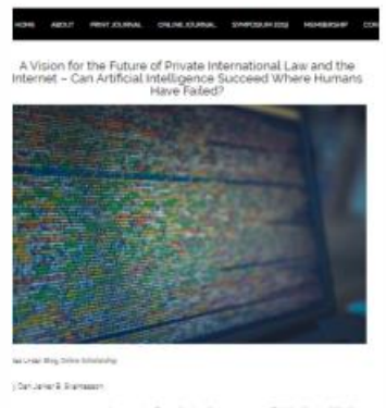
A Vision for the Future of Private International Law and the Internet – Can Artificial Intelligence Succeed Where Humans Have Failed? Del 04.08.19, por Dan Jerker Svantesson.