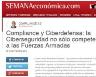
Compliance y Ciberdefensa: la Ciberseguridad no sólo compete a las Fuerzas Armadas, del 01.09.19, por Dino Carlos Caro Coria.