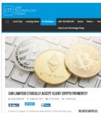
Can Lawyers Ethically Accept Client Crypto Payments? del 29.08.19, por Kayla Matthews.