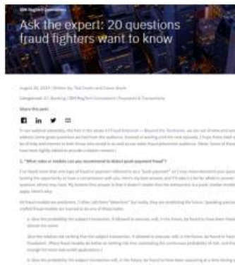
Ask the expert: 20 questions fraud fighters want to know, del 28.08.19, por Ted Crooks y Ciaran Doyle.