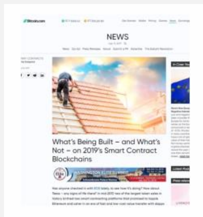
What's Being Built – and What's Not – on 2019's Smart Contract Blockchains, del 30.08.19, por Kai Sedgwick. ▶