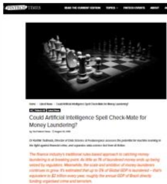
Could Artificial Intelligence Spell Check-Mate for Money Laundering? del 29.08.19, por Karthik Tadlnada.