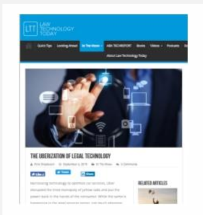
The Uberization of Legal Technology, del 04.09.19, por Felix Shipkevich. ▶