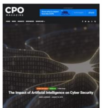
The Impact of Artificial Intelligence on Cyber Security, del 22.08.19, por Aimee Lauren.