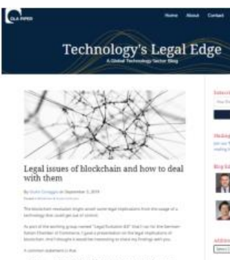
Legal issues of blockchain and how to deal with them, del 03.09.19, por Giulio Corraggio.