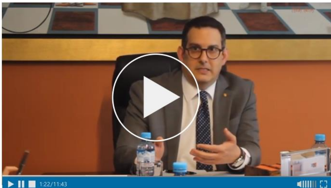
LIX CONVERSATORIO DEL CENTRO DE ESTUDIOS DE DERECHO PENAL ECONÓMICO Y DE LA EMPRESA. ▶

TEMA: Cibercriminalidad y nueva teoría del delito