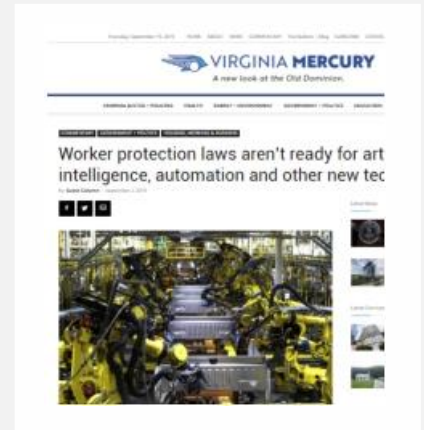
Work protection laws aren't ready for artificial intelligence, automation and other new technology, del 02.09.19, por Jeffrey Hirsch. ▶