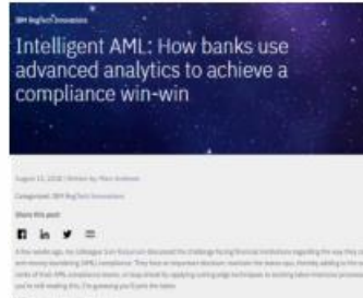
Intelligent AML: How banks use advanced analytics to achieve a compliance win-win, del 15.08.19, por Marc Andrews.